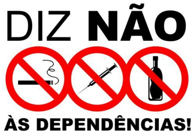
Figura 2 - A Política de Atenção Integral em Álcool e outras Drogas. Ministério da Saúde do Brasil.