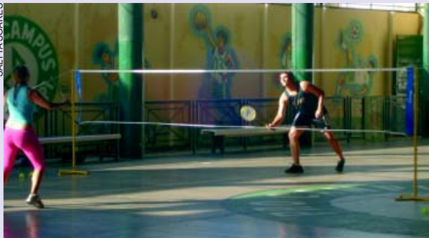
Badminton: um esporte diferente que tem cativado o piauiense