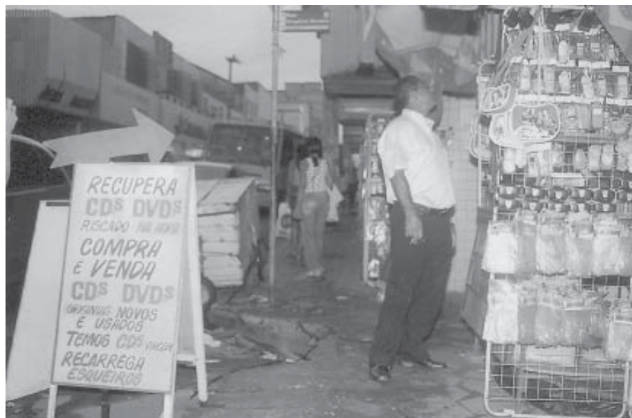
CDs e DVDs são os produtos mais pirateados

Segundo Clementino o CD gravado é vendido a R$ 2,00 e o DVD a R$ 4,00. As lojas que repassam os produtos virgens