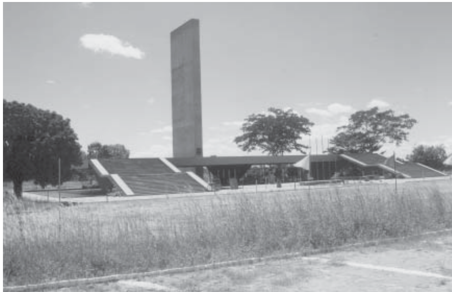
O descaso ofende a importância do monumento