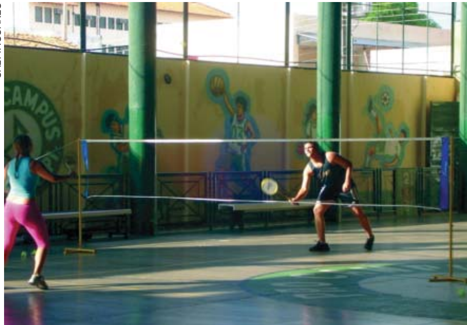
Prática entre jovem e adulto

O esporte é praticado numa quadra de 13,40m x 6,10 m. É um jogo no qual se utiliza uma peteca e raquetes. As petecas usadas em competições pesam entre 4.74 e 5.50 gramas. A raquete é, sem dúvida, o