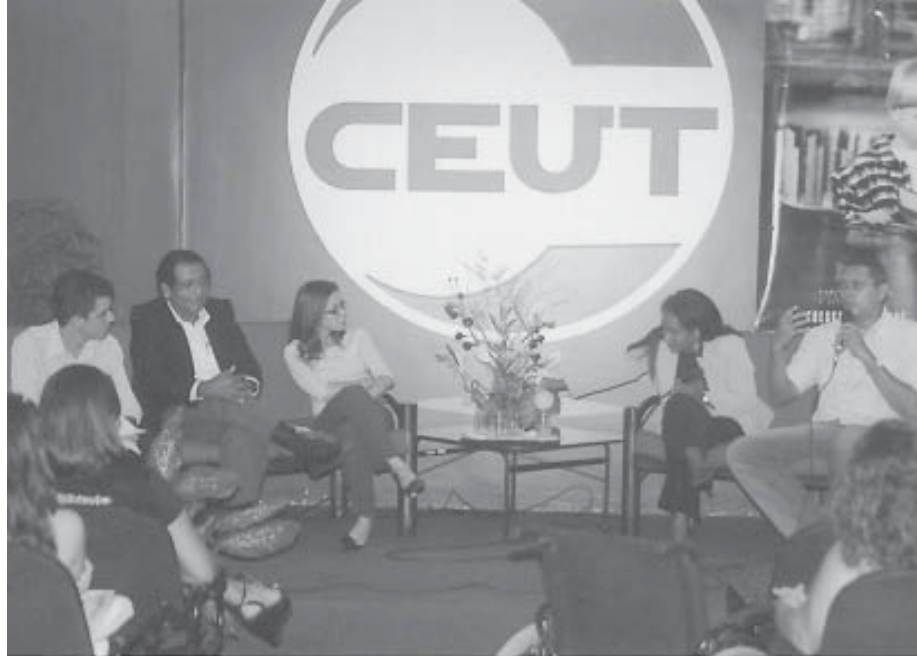
Representantes dos meios de comunicação local