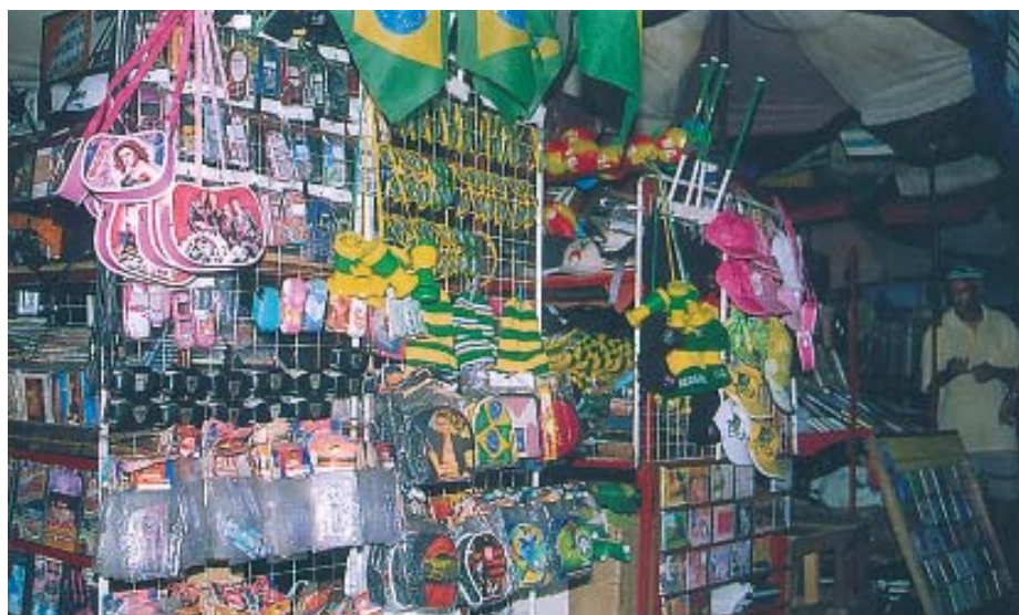
A pirataria atua sem limites no centro da cidade