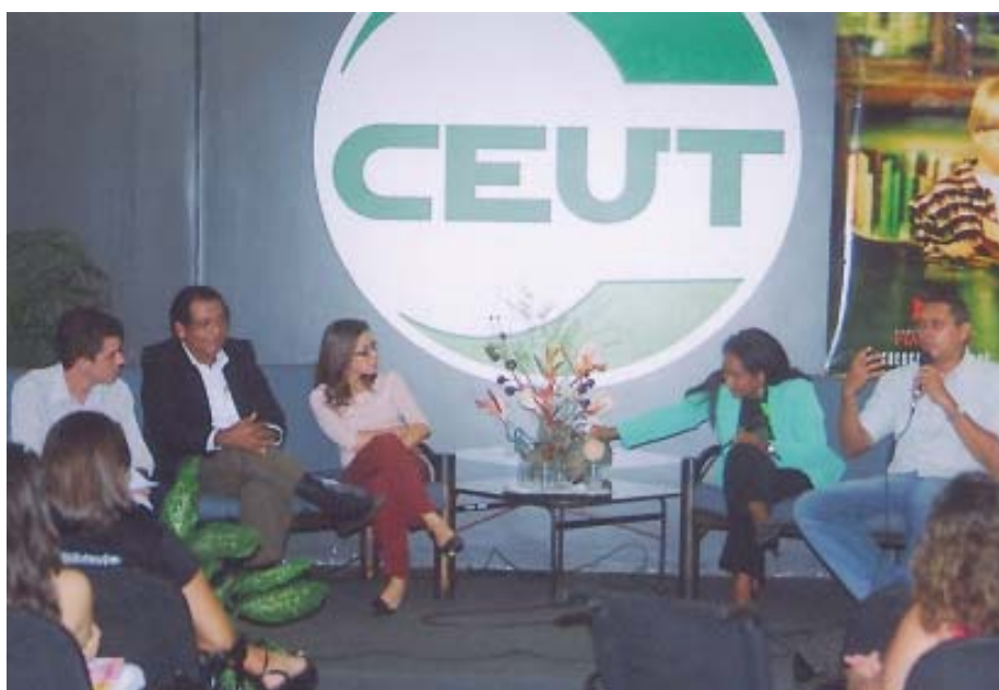
Representantes do jornalismo piauiense em mesa redonda no CEUT