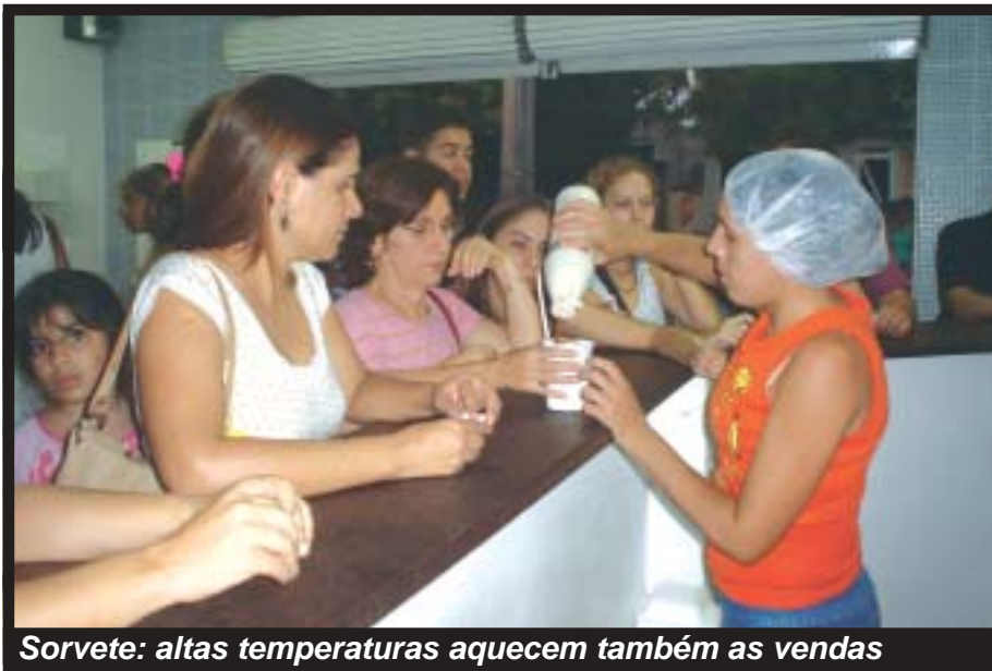
Sorvete: altas temperaturas aquecem também as vendas

derada a “cidade verde”, está abaixo desta faixa, com apenas 8% de extensão verde. Se forem consideradas as áreas particulares nossa capital alcança a casa dos 13%.