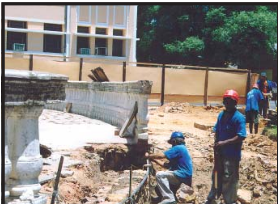
Praça Landri Sales (Liceu), um dos símbolos da cidade