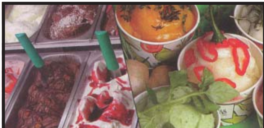
Guloseimas irresistíveis para as crianças

O tratamento ao combate da obesidade faz-se com uma dieta balanceada que determina o crescimento adequado e manutenção do peso, exercícios físicos controlados e apoio emocional.