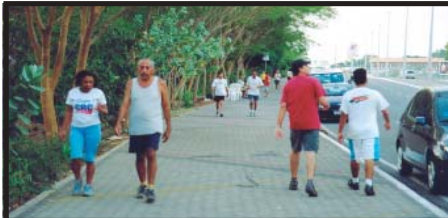
Atividade física em Teresina deve aliar saúde e segurança

bras musculares, náusea e tontura, apenas alguns sinais da desidratação. A perda de dois a três por cento do seu peso corporal devido à desidratação pode atrapalhar sua performance durante os exercícios.