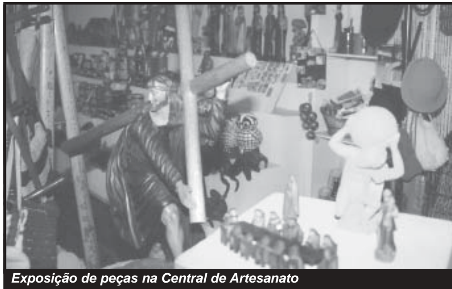
Exposição de peças na Central de Artesanato

São vários os pontos de divulgação e comercialização da arte artesanal dentro do estado do Piauí. Dentre eles se destacam a central de Artesanato Irmãos Cordeiro, em Pedro II, Galeria de Artes – Central de Artesanato Porto das barcas, em Parnaíba, loja Cabeça de Cuia III, em Floriano, o artesanato do bairro Poty Velho, em Teresina e, é claro, a Central Artesanal de Teresina, que é um dos maiores referenciais da arte no estado. Além destes pontos, o artesanato piauiense se faz presente em outras localidades como Buriti dos Lopes, Campo Maior, Ilha Grande, Piracuruca, São Raimundo Nonato, entre outras que se