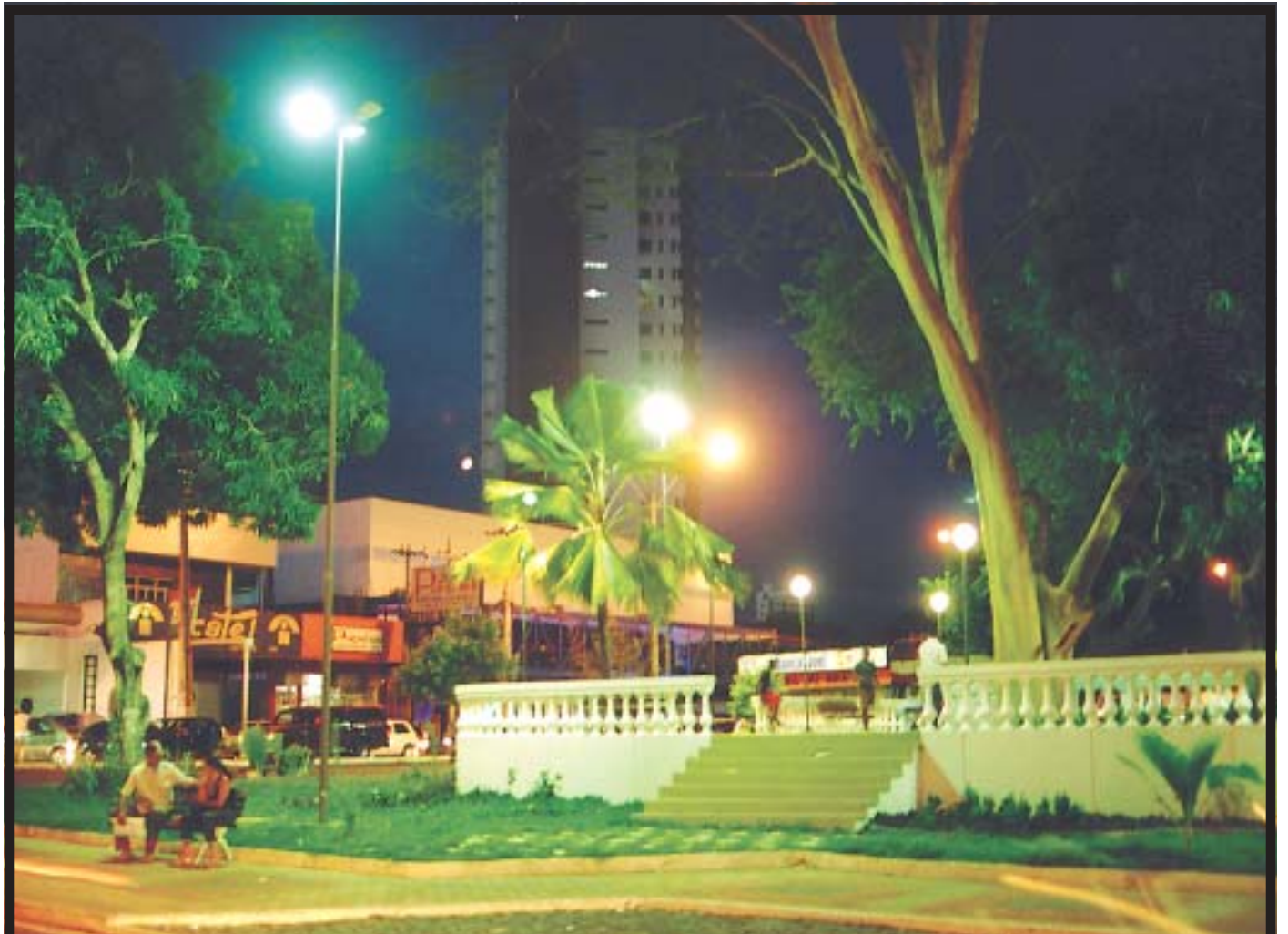
Praça Ministro Pedro Borges, no Jóquei: reforma revitalizou a paisagem urbana